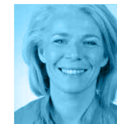
SEREINE MAUBORGNE Infirmière libérale, chargée de mission APHP, députée de la 4e circonscription du Var de 2017 à 2022.